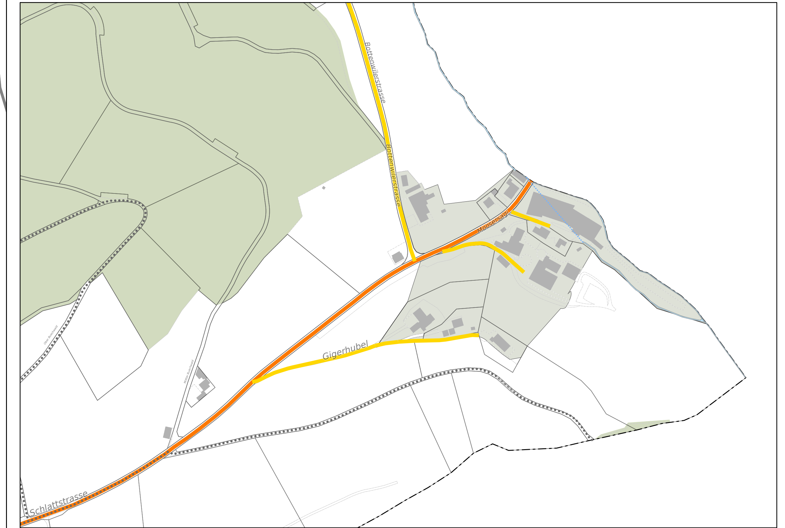
Ausschnitt Weiler Hintermoos, 1:2'500